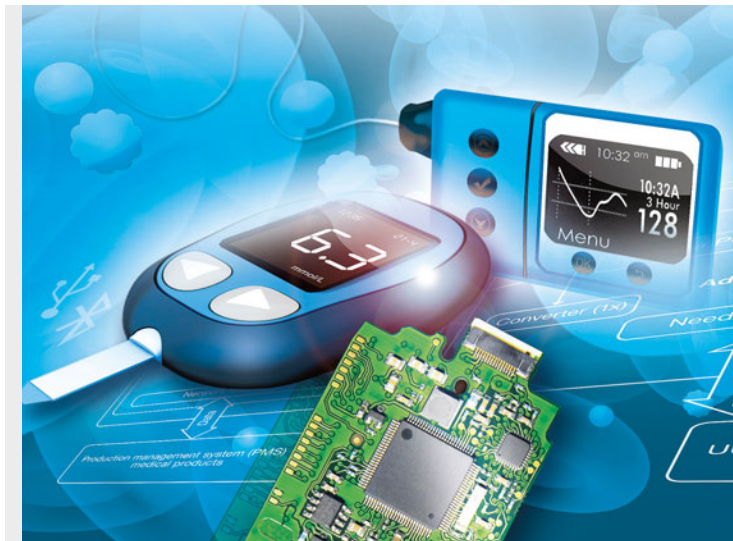
>> Elektronik in Medizingeräten nimmt beständig zu.